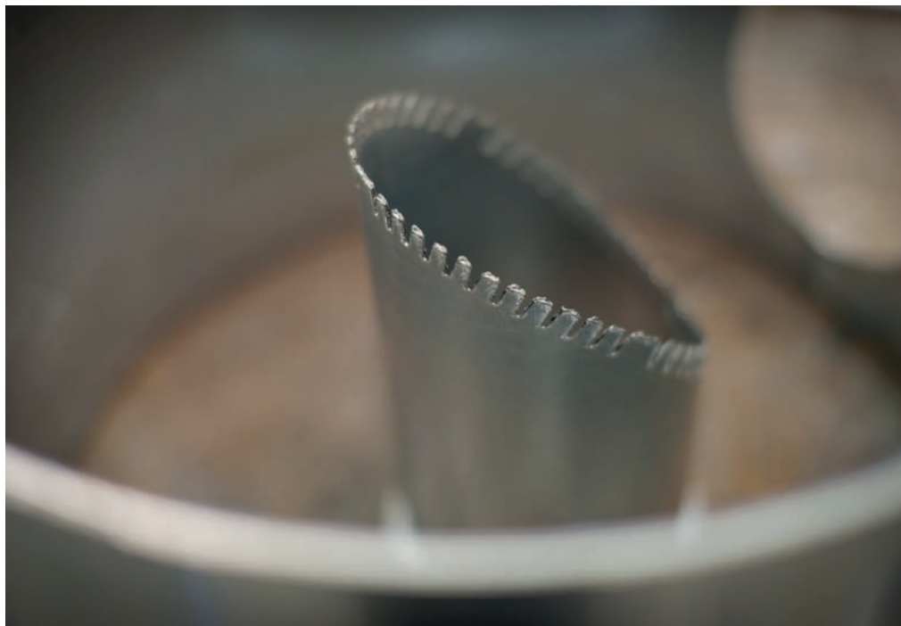
Installaties worden niet alleen op papier veilig ontworpen, maar daadwerkelijk in de praktijk getest.

staat om de concurrentie aan te gaan met bedrijven die veel minder tijd en geld stoppen in het daadwerkelijk testen op veiligheid. Eén van de zaken die we voortvarend ter hand nemen, zijn de gesprekken met verzekeraars en de brandweer. Wanneer de premies voor de verzekeringen omlaag kunnen als bedrijven investeren in