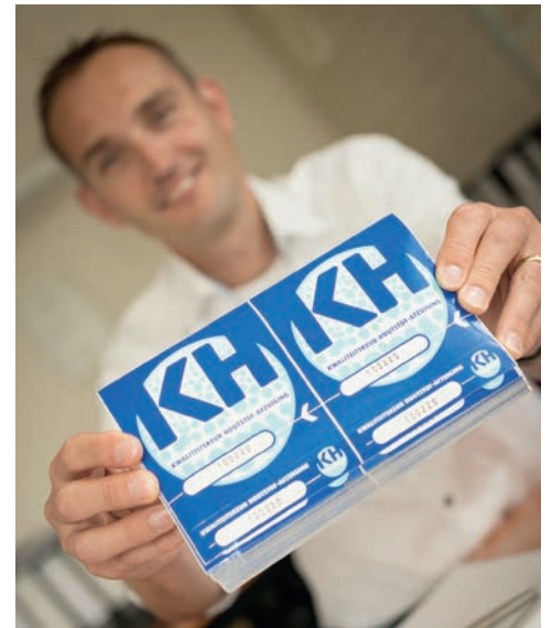
De SKH-certificering betekent een belangrijke stap vooruit voor de bedrijfstak.

werking met Schuko zijn we in staat onze installaties niet alleen op papier veilig te ontwerpen, maar testen we ze daadwerkelijk in de praktijk. De apparatuur is aan de binnenzijde geheel glad afgewerkt – naar buiten gekant – waardoor er geen materiaalafzetting in het filter mogelijk is. Een ander belangrijk detail is de optimaal berekende drukontlasting. Mocht zich onverhoopt een stofexplosie voordoen, dan zal de vlam gecontroleerd kunnen ontsnappen. We produceren volgens de gecertificeerde ATEX-normen.”